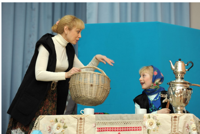
Родители активно помогали ребятам не только в подготовке

Театр – это глобальное столкновение реальности и мира фантазии в искусстве, подобное безумному вихрю. Вобрав в себя всю таинственность литературы, завладевающую сознанием музыку и головокружительную красоту живописи, этот вихрь подхватывает зрителей и уносит за собой в мир, где не существует границ между действительностью и воображением.