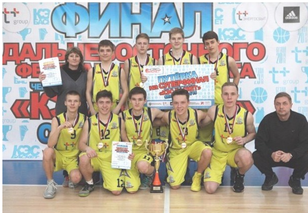
«Золотой» состав гимназии №2 по баскетболу

Отдельно хотелось бы отметить подрастающую