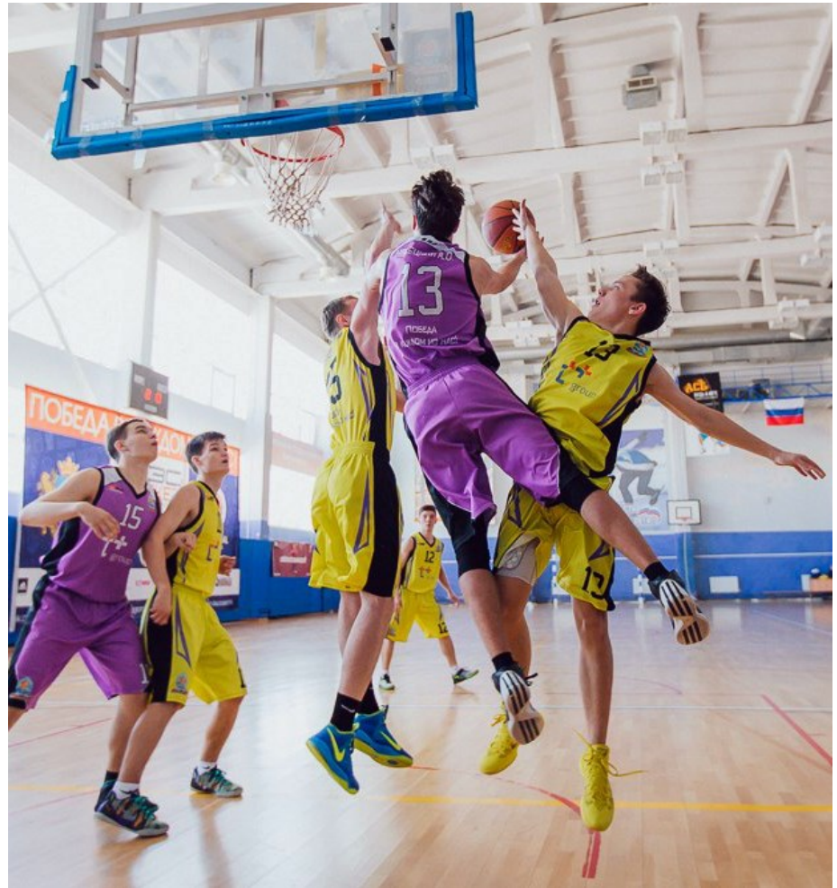
Команда гимназии вошла в топ-школ России. Какого это – оказаться на вершине?